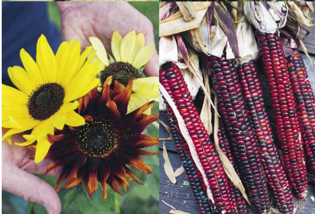
Överst t v: Sockermajs (Zea mays Saccharata-gruppen) 'Trinity', 'Fleet', 'Mystique', 'Delectable' och däremellan den brokiga prydnadsmajsen (Zea mays Indurata-gruppen), även kallad flintmajs för sina hårda korn. Överst t h: Fält med sockermajs i prydliga rader. Övan t v: Solrosor 'Autumn Beauty' i olika färger. Övan t h: Prydnadsmajs av sorten 'Painted Mountain'.