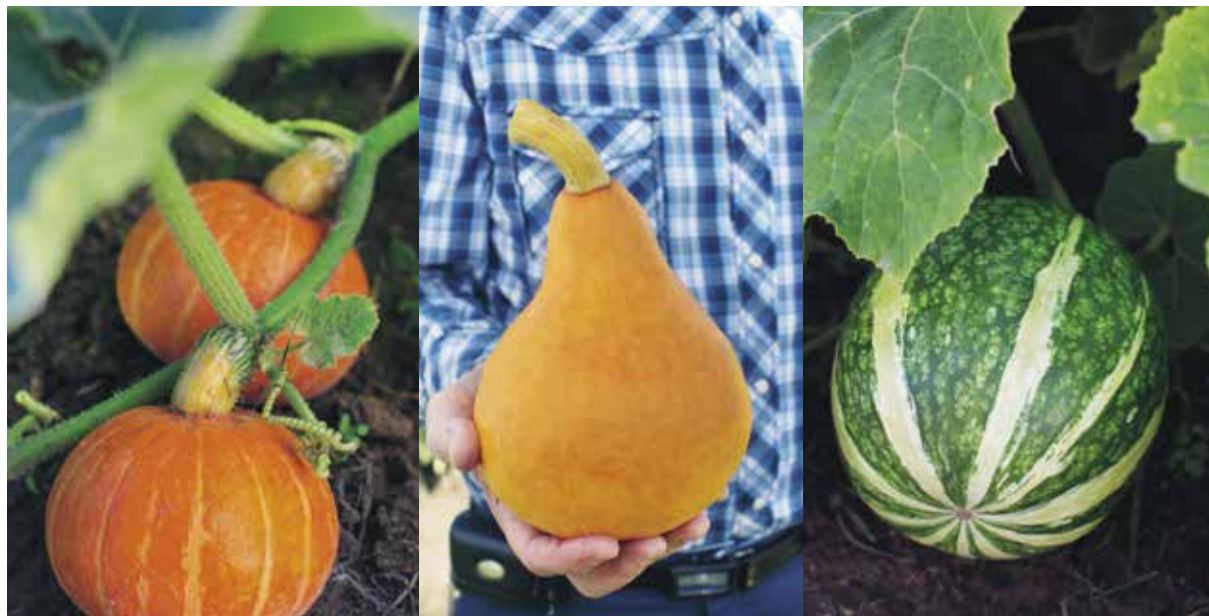
Ätbar och vacker trio. Från vänster: 'Orange Cutie', ( Cucurbita maxima ), 'Red October' ( C. maxima ) och fikonbladspumpa ( C. ficifolia ).

grobarhet, avkastning och resistens är värdefulla – och på våra breddgrader handlar det ofta om vilka sorter som hin- ner mogna under den korta svenska växtsäsongen