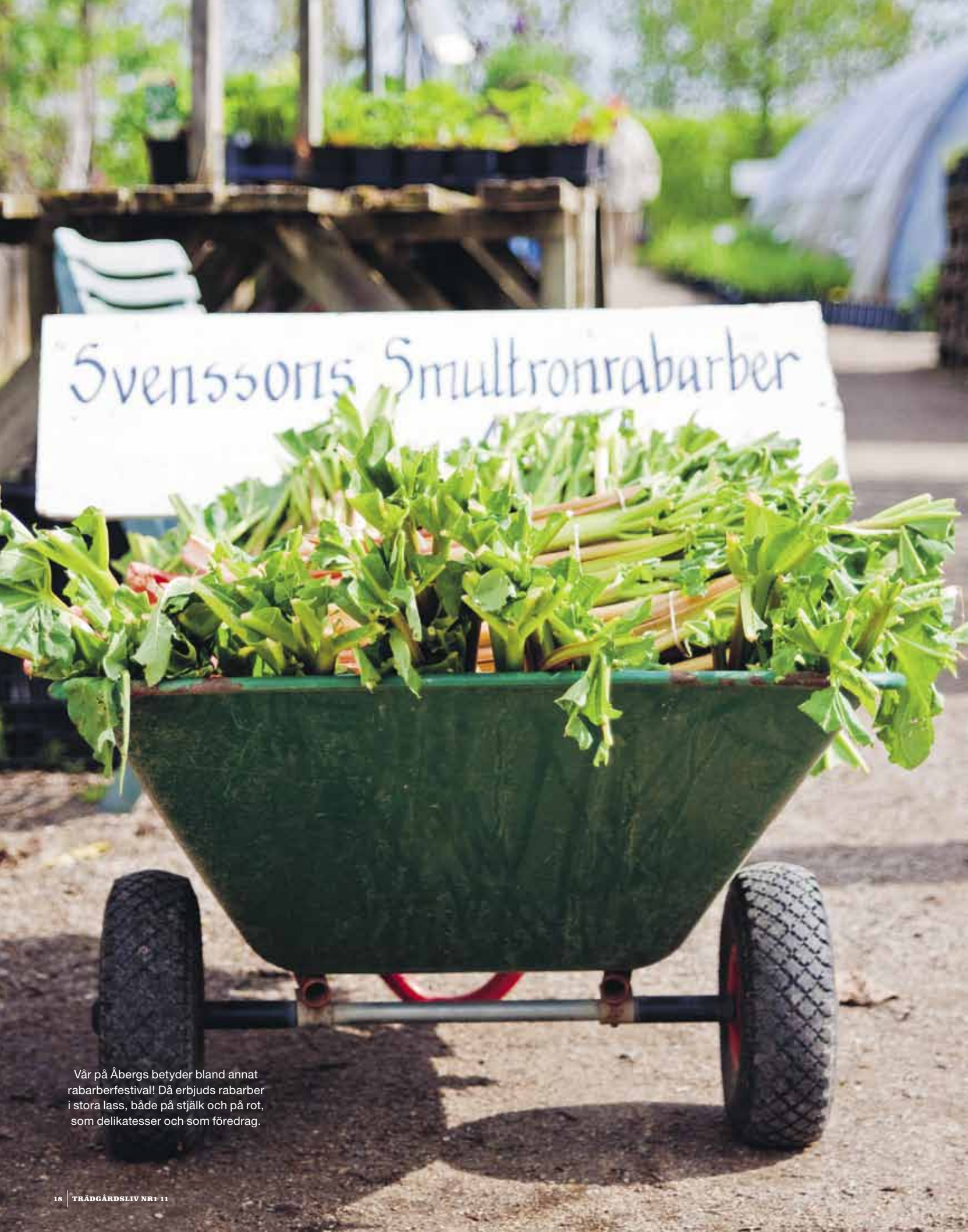
Vår på Åbergs betyder bland annat rabarberfestival! Då erbjuds rabarber i stora lass, både på stjälk och på rot, som delikatesser och som föredrag.

T v: Vårens första yppiga grönska i visningsträdgården; spansk körvel och daggekåpa – under ett valv av blommande äppelträdet 'Transparente Blanche'. Mitten: Nästan alla plantor dras upp på egen hand: sedum, alunrot och fjäderborstgräset Pennisetum Rubrum väntar på att krukas. T h: Luktolvon doftar vida omkring