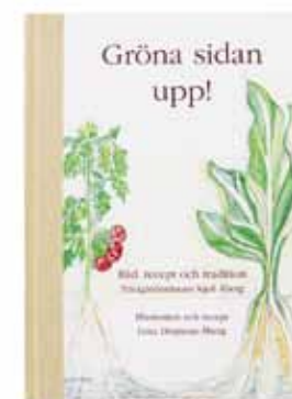
Gröna sidan upp! är utgiven på Åbergs eget förlag. Här berättas historier från fyra generationers odlarliv och bjuds generöst på mängder av tips och knep. Den är också trädgårdsmästarens bästa kokbok med recept på allt gott man kan laga av skörden. Finns att beställa på www.abergsgarden.nu .

Fler böcker lär bli skrivna över skyffeljärnet. Nästa ska handla om människor. Det vet han redan. 🌿