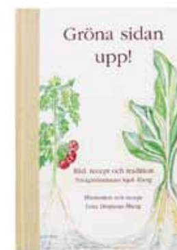
Gröna sidan upp! är utgiven på Åbergs eget förlag. Här berättas historier från fyra generationers odlarliv och bjuds generöst på mängder av tips och knep. Den är också trädgårdsmästarens bästa kokbok med recept på allt gott man kan laga av skörden. Finns att beställa på www.abergsgarden.nu .

Fler böcker lär bli skrivna över skyffeljärnet. Nästa ska handla om människor. Det vet han redan. 🌿