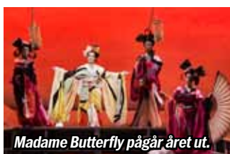
Madame Butterfly pågår året ut.