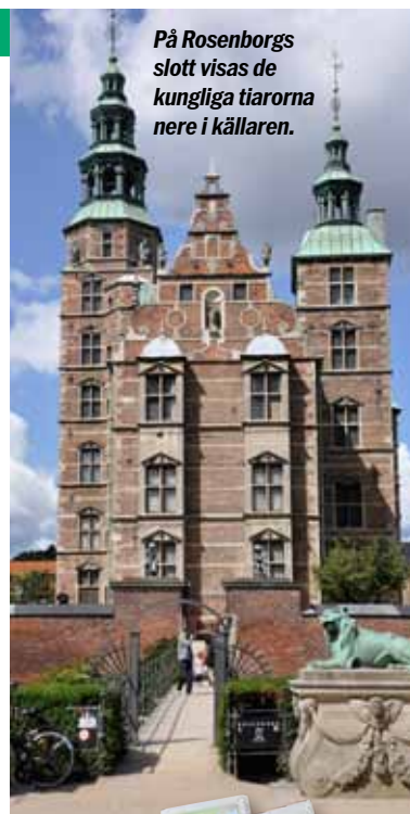
På Rosenborgs slott visas de kungliga tiarorna nere i källaren.