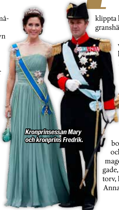
Kronprinsessan Mary och kronprins Fredrik.

Den finaste vyn över Amalienborg har man från vattnet. Utflyktsbåtar avgår bland annat från Holmens bro eller från kajkanten bakom slottet. Från vattensidan syns Marmorkyrkans magiska 1700-talskupol och Amaliehaven med springvatten, form-