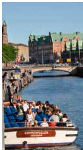
TILL HAVS. Med båt får du den bästa utsikten över staden.