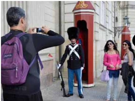
SMILE! Glada turister försöker, utan framgång, locka fram ett leende hos en av vakterna ute på borggården på Köpenhamns slott.