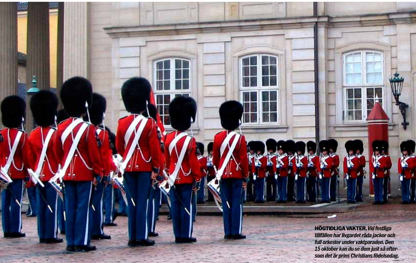
HÖGTIDLIGA VAKTER. Vid festliga tillfällen har livgardet röda jackor och full orkester under vaktparaden. Den 15 oktober kan du se dem just så eftersom det är prins Christians födelsedag.