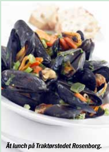
Ät lunch på Traktørstedet Rosenberg.

Prova "Smushi" - smørrebrød i sushi-format - på The Royal café.