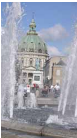
GOTT OM PLATS. På Amalienborg bor danska kungafamiljen.